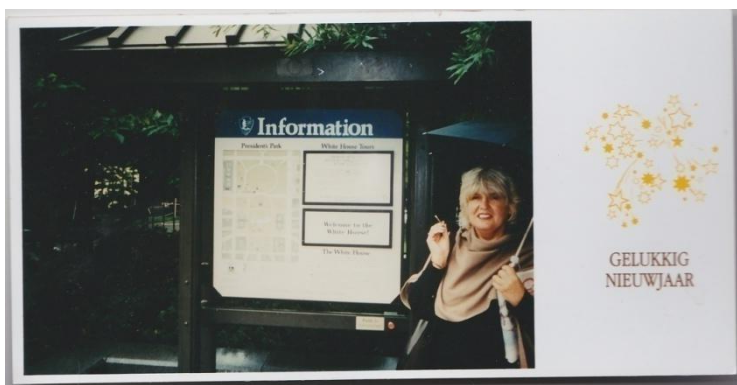
Foto: Bezoekersingang Het Witte Huis Washington