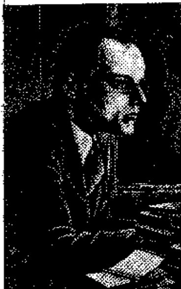
23 De Vries: Amsterdam. 18 februari 1991

Maar, vraag ik dan, weet deze filosofische ironicus niet dat het besef van verscheidenheid naop tot ruizering en relativering? En dat debatten over de 'de ach-